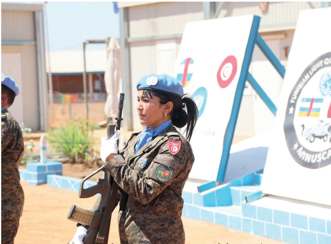
Le mérite des femmes sur le terrain est reconnu de façon unanime