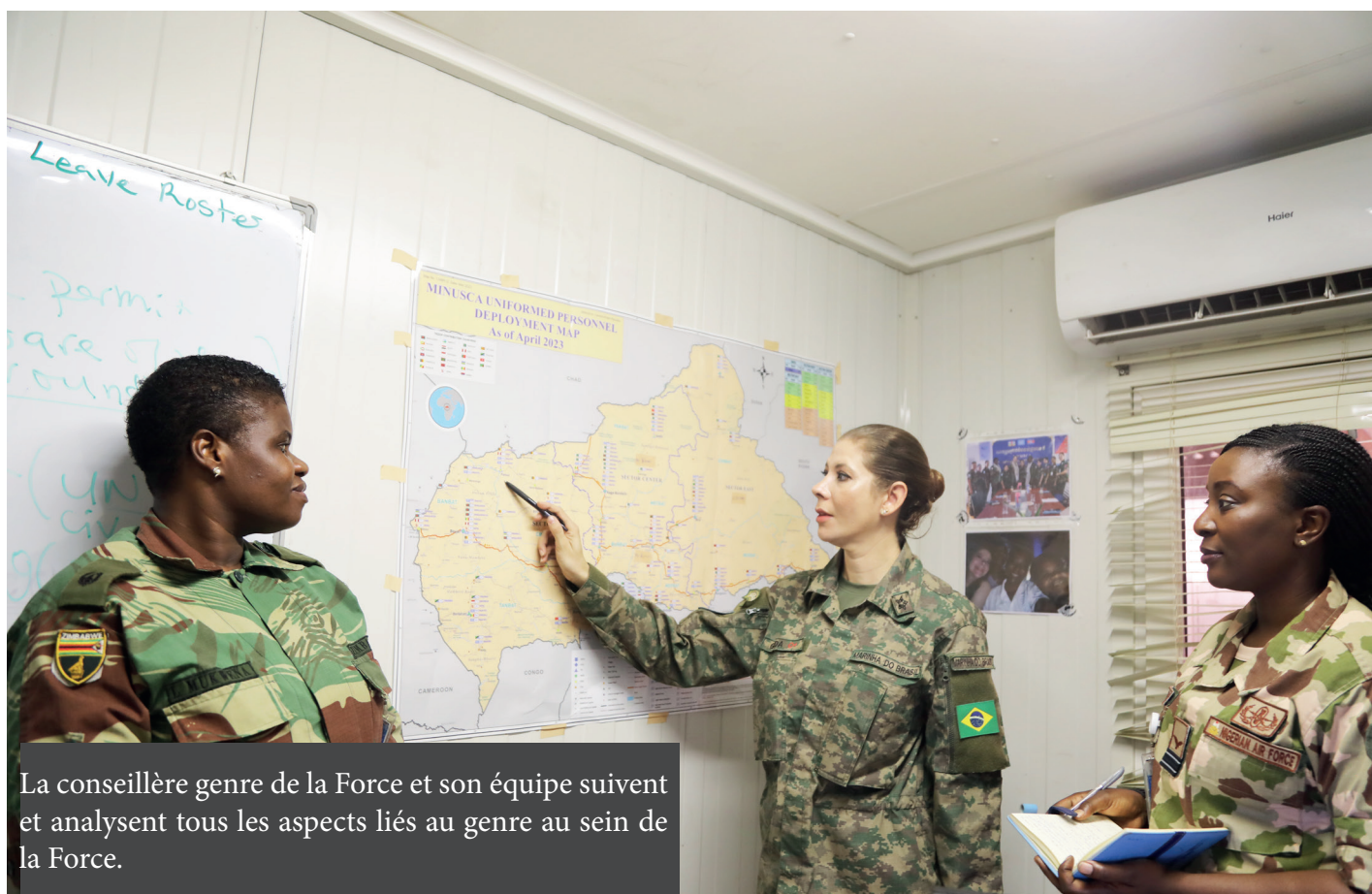
La conseillère genre de la Force et son équipe suivent et analysent tous les aspects liés au genre au sein de la Force.

L'intégration de la dimension de genre ne nécessite pas nécessairement de nouveaux programmes ou de nouvelles approches; une grande partie peut être facilement incorporée dans les efforts de PoC existants. Des stratégies peuvent être intégrées dans chacune des trois PoC, à savoir la protection par le dialogue et l'engagement, la fourniture d'une protection physique et la mise en place d'un environnement protecteur.