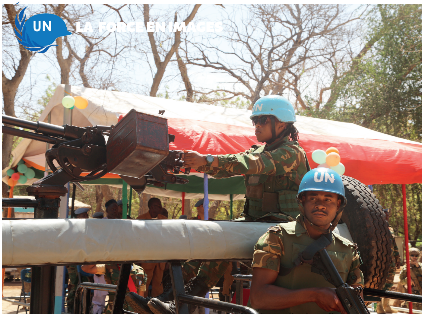
Sur le terrain, les femmes assument des fonctions opérationnelles