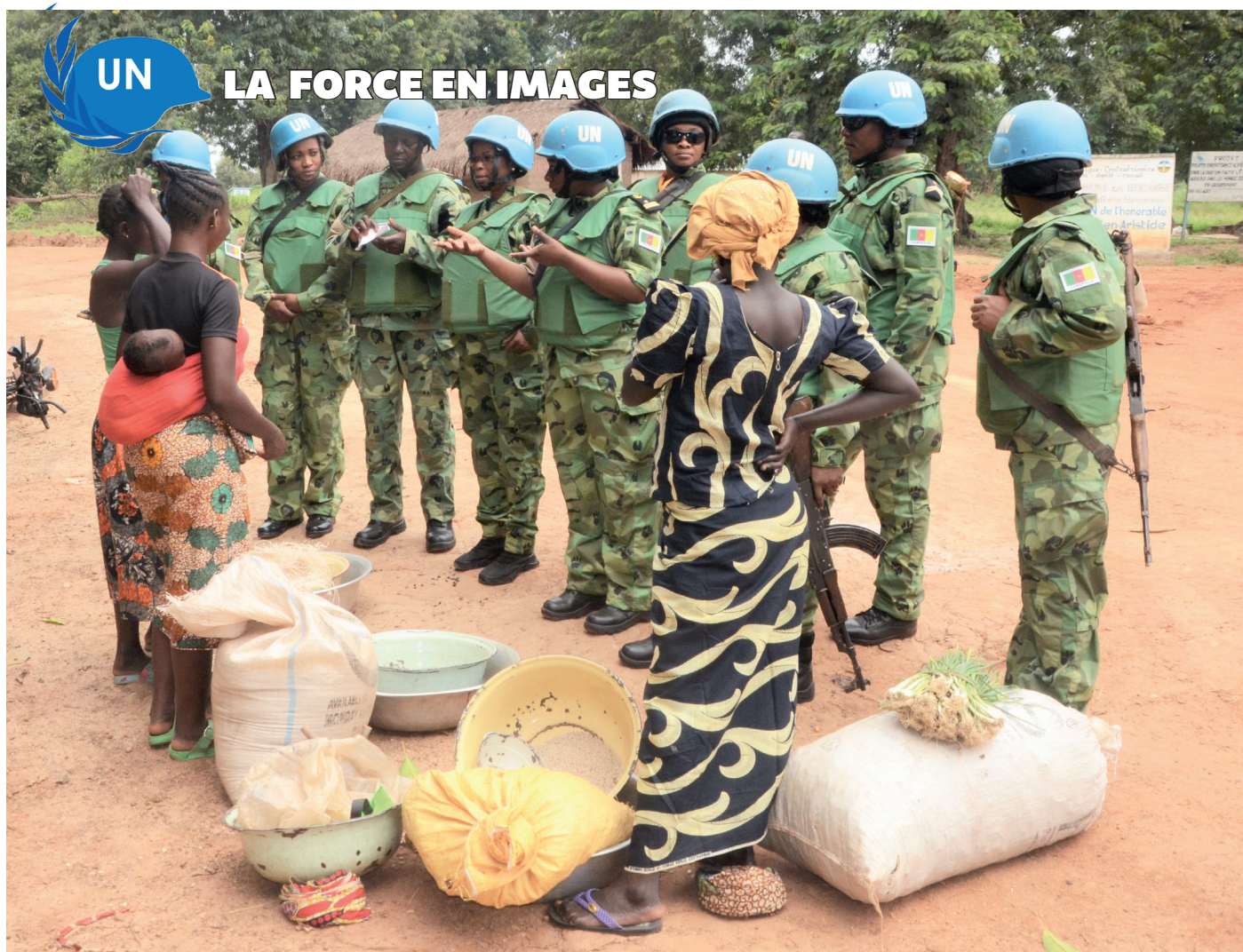
Au niveau communautaire, les femmes sont particulièrement engagées dans la mise en oeuvre du mandat.