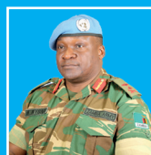
Général Humphrey NYONE, Commandant de la Force