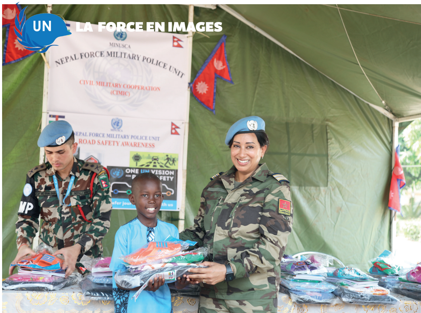
Les femmes jouent un rôle important dans la conduite des activités civilo-militaires de la Force.