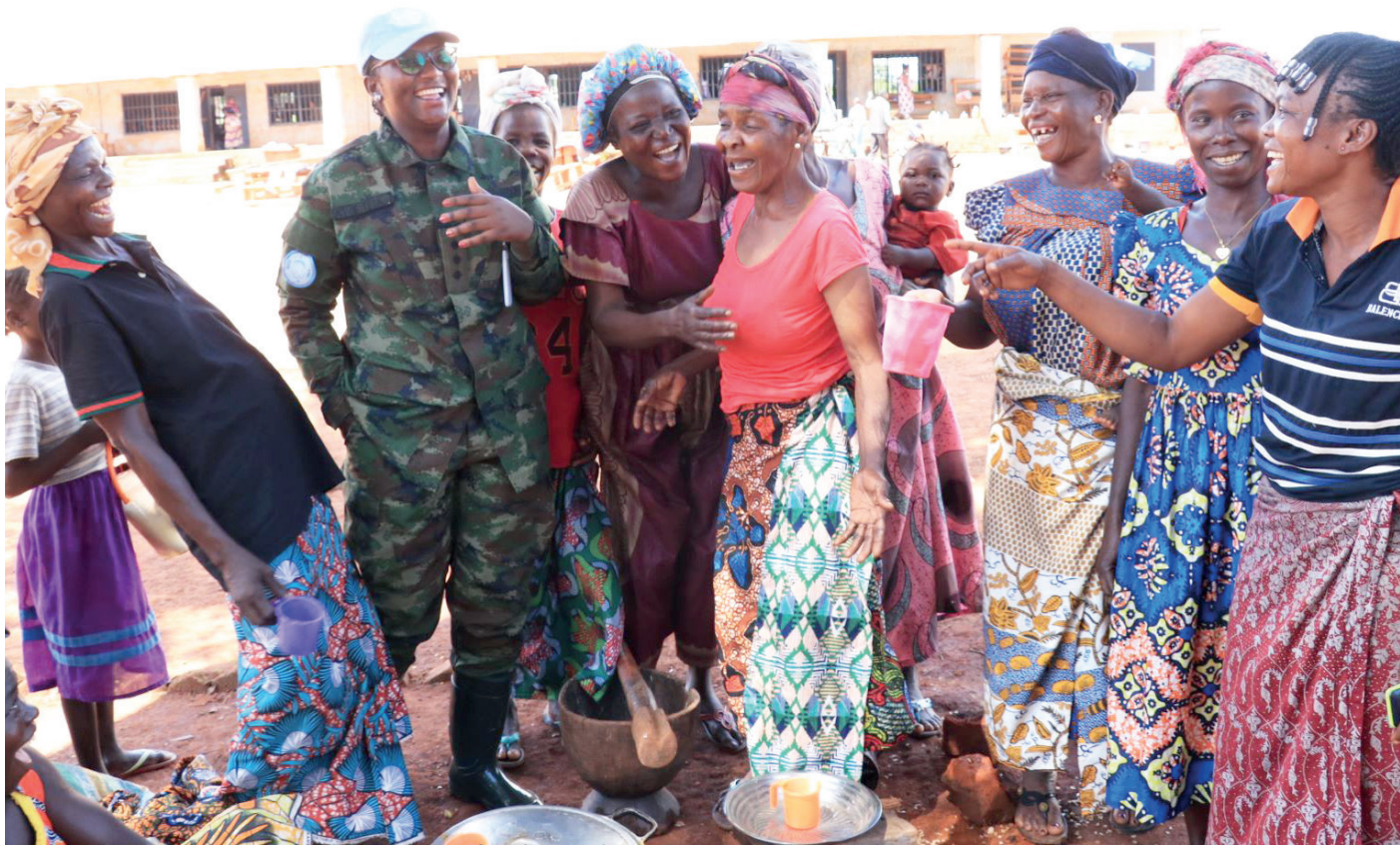
Les femmes facilitent les interactions avec les populations locales.